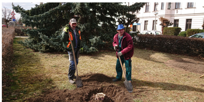
Úprava zeleně na náměstí.