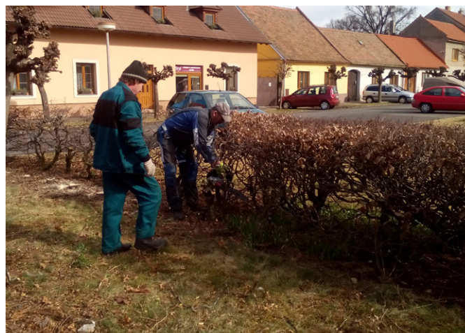
Do konce listopadu bude při údržbě veřejných prostranství pomáhat pracovník dotovaný Úřadem práce.