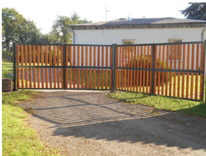
Opravená vrata do areálu MŠ