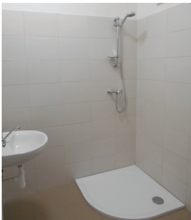
Nové sociální zařízení v ZŠ