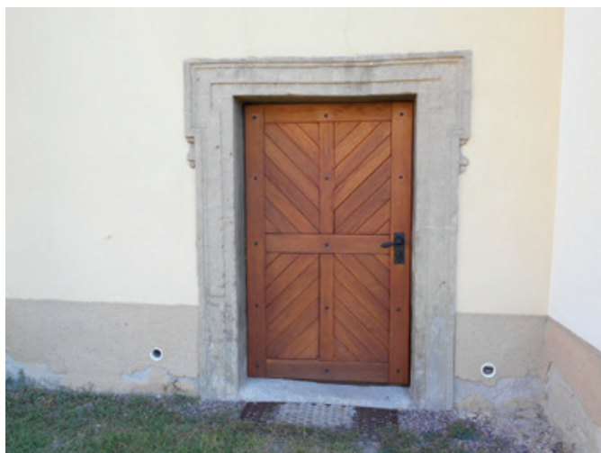
Vstupní dveře do kostela konečně v novém.