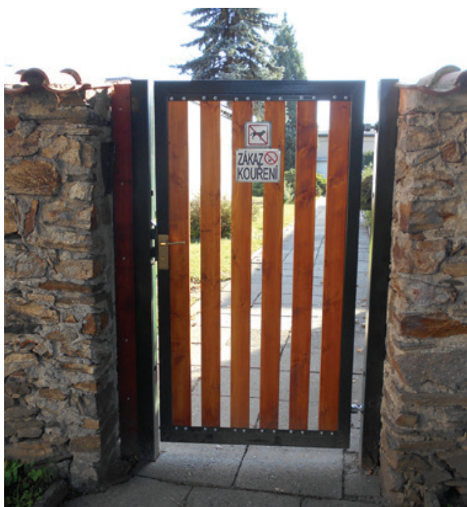
Opravená vrata do areálu MŠ