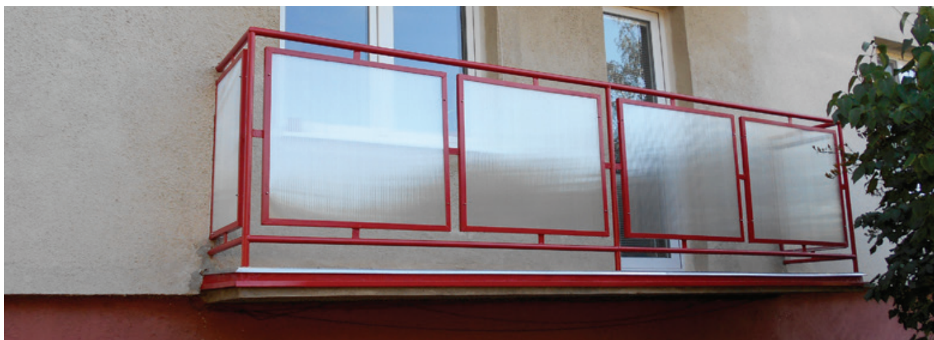
Zbývající dva přízemní balkony zdravotního střediska čekaly na svou opravu opravdu dlouho.